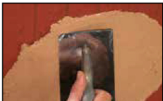
Étape 1 - application directe sur brique plâtrière légèrement humidifiée (pas de sous couche de fond ou d'accroche)