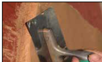
Étape 2 - application à la spatule inox ou à la machine à projeter, sur 1cm d'épaisseur.