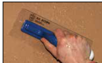
Étape 3 - à mi-séchage, resserer l'enduit à l'aide d'une spatule plastique souple.